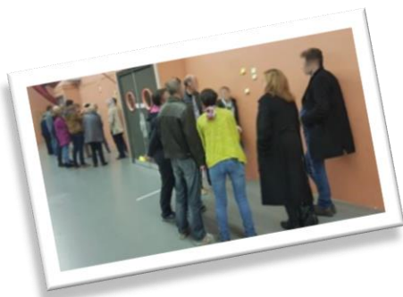
Atelier participatif - Réunion pré-électorale du 1 er tour des élections municipales 2020.

Cette lettre d'information va nous permettre d'échanger régulièrement avec vous et ainsi de créer une chaîne de liens entre les habitants de la commune. Pour nous, la solidarité et le soutien restent une priorité absolue. Faire de la politique, c'est aller au contact des habitants de la commune, aller au contact de nos voisins, aller à votre contact. A travers cette lettre, nous souhaitons également rassembler, expliquer notre démarche, raconter qui nous sommes et ce que nous voulons faire avec vous.